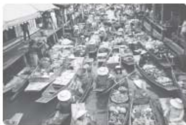
بازار شناور - بانکوک

مثال ۱ بازارهای شناور بانکوک (پایتخت تایلند) که از دیدنی‌های آسیای جنوب شرقی است، در اثر دخالت و دستکاری انسان در محیط ساحلی این ناحیه به وجود آمده است. در این بازارها، دستفروشان در قایق‌های چوبی بر روی رودخانه اصلی این شهر، کالاهای خود را برای فروش عرضه می‌کنند. این شیوه خاص فروش کالا، ناحیه تجاری و گردشگری خاصی را برای بازدید گردشگران خارجی ایجاد کرده است.