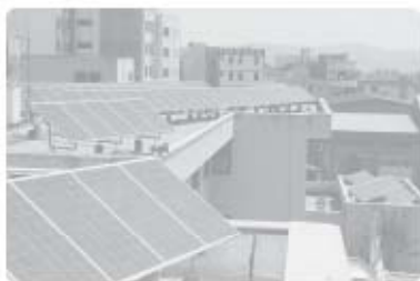
استفاده از صفحه‌های خورشیدی - اداره برق سمنان

از یک سو، انسان‌ها با پیشرفت در تولید ابزار و فناوری و دانش بر محیط طبیعی غلبه می‌کنند و آن را تحت اختیار خود درمی‌آورند؛ از سوی دیگر، ویژگی‌های هر ناحیه طبیعی همواره زندگی مردم ساکن در آن را تحت تأثیر قرار می‌دهد.