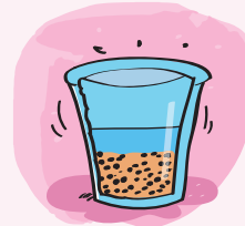
مخلوط غیریکنواخت ماسه در آب