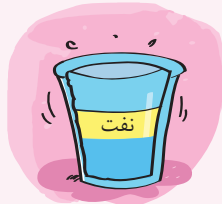
مخلوط غیریکنواخت نفت در آب