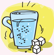
محلول آب و قند

در این نوع مخلوط‌ها، مواد به صورت کاملاً یکنواخت پراکنده می‌شوند؛ به طور مثال در محلول قند در آب، ذرات قند پس از حل شدن در آب دیده نمی‌شوند.