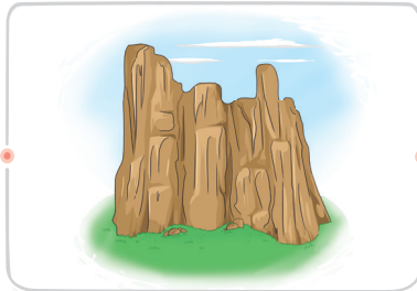
صخره: سنگ سخت